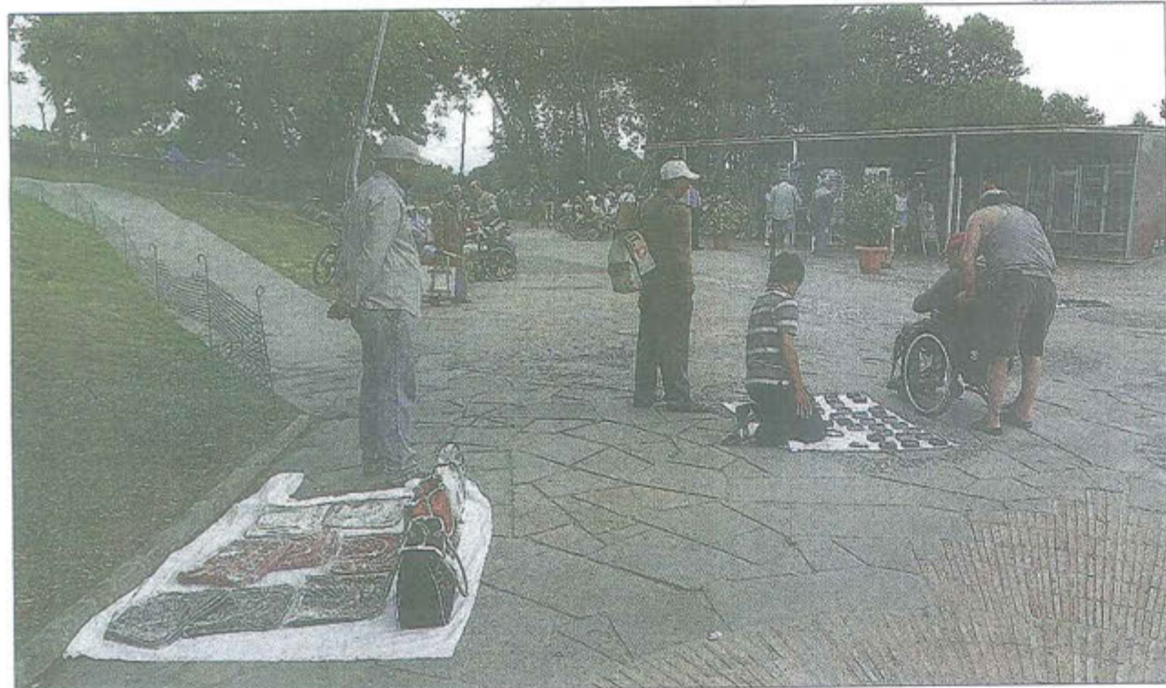
Algunos puestos de venta ambulante en el Mirador del Alcalde, en Montjuïc, el lunes por la mañana.

O sea, que Lluís Reverter que, físicamente, siempre ha parecido más convergente que socialista, sigue teniendo el perfil de cierto personaje de Shakespeare, por su puesto inquietante, que no mencionaré aquí porque esto va de celebración, de conmemoración. Y el exalcalde Narcís Serra conserva todo el pelo y no parece que haya perdido la calma aparente que siempre le ha caracterizado.